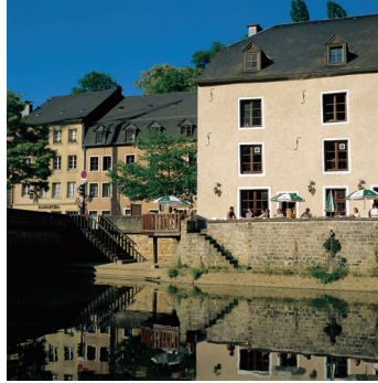
K08_046 CD-Rom: 08 Luxemburg • Luxemburg City • Im Grund