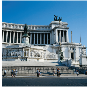
K08_018 CD-Rom: 08 Italien • Rom • Monumento Vittorio Emanuele