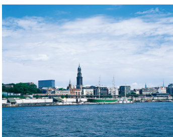
K08_013 CD-Rom: 08 Deutschland • Hamburg • Hafenpanorama mit St. Michaelis