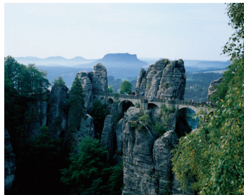
K08_006 CD-Rom: 08 Deutschland • Elbsandsteingebirge • Bastei