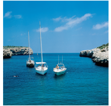
K08_020 CD-Rom: 08 Spanien • Mallorca • Cala Sa Nau