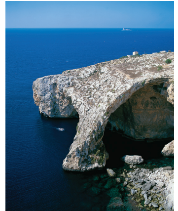
K08_004 CD-Rom: 08 Malta • Zurrieg • Blaue Grotte von Zurrieg