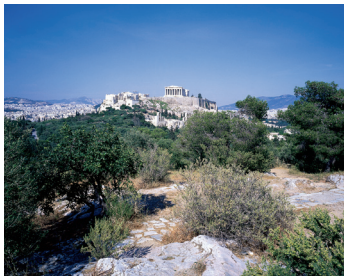
K08_039 CD-Rom: 08 Griechenland • Athen • Blick vom Filopappou-Hügel zur Akropolis