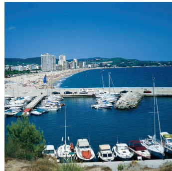
K08_041 CD-Rom: 08 Spanien • Playa de Aro • Strand und Hafen