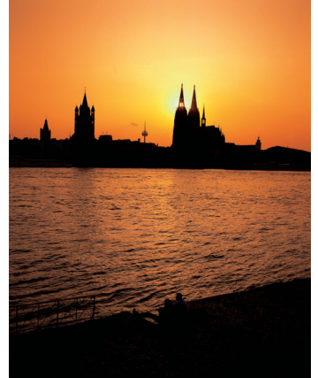
CD-Rom: 08 Deutschland • • Rhein, Dom und Groß- St. Martin