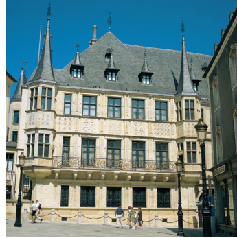
K08_047 CD-Rom: 08 Luxemburg • Luxemburg City • Palais Grand-Ducal