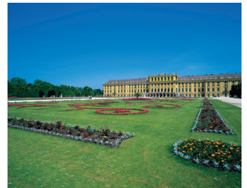
K08_008 CD-Rom: 08 Österreich • Wien • Schloß Schönbrunn