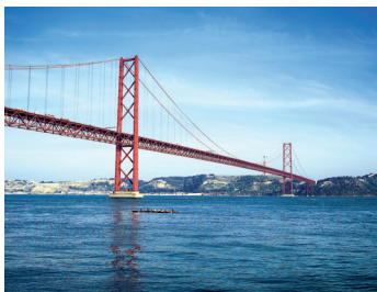
K08_021 CD-Rom: 08 Portugal • Lissabon • Ponte de 25 Abril über den Tejo und Christus Statue