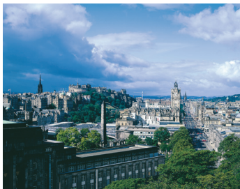
K08_035 CD-Rom: 08 Schottland • Edinburgh • Blick vom Carlton Hill auf Altstadt und Castle