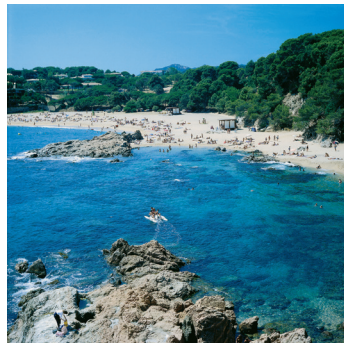
K08_040 CD-Rom: 08 Spanien • Costa Brava • Strand bei Tossa