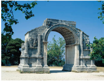
K08_001 CD-Rom: 08 Frankreich • St. Remy de Provence • Triumphbogen