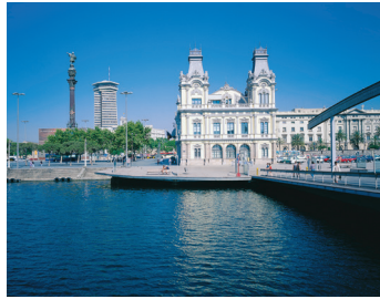
K08_002 CD-Rom: 08 Spanien • Barcelona • Port Vell mit Kolumbus-Monument