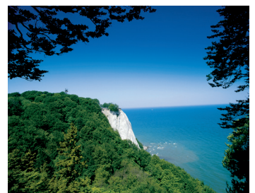
K08_012 CD-Rom: 08 Deutschland • Insel Rügen • Kreidefelsen Stubbenkammer