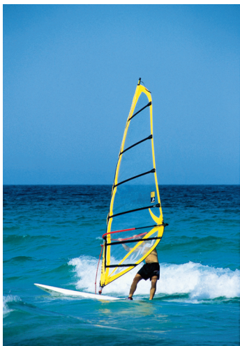
K08_025 CD-Rom: 08 Sport • Windsurfen