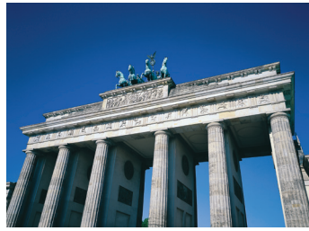
K08_032 CD-Rom: 08 Deutschland • Berlin • Brandenburger Tor