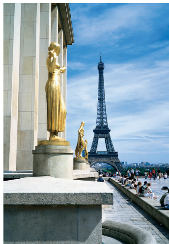
K08_026 CD-Rom: 08 Frankreich • Paris • Palais de Chaillot und Eiffelturm