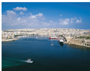
K08_010 CD-Rom: 08 Malta • Marsamxett • Hafen von Gzira und Sliema