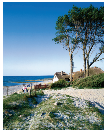
K08_027 CD-Rom: Volume 08 Deutschland • Ahrenshoop • Darß-Fischland Ahrenshoop