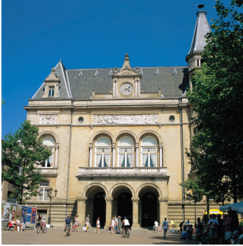
K08_045 CD-Rom: 08 Luxemburg • Luxemburg City • Paradeplatz mit Stadtpalais