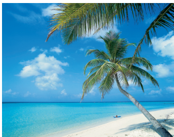
K08_043 CD-Rom: 08 Karibik • Trop. Strand mit Palmen