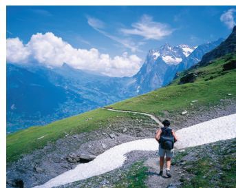
K08_011 CD-Rom: 08 Schweiz • Wetterhorn/Berner Oberland • Blick vom Eiger-Trail zum Wetterhorn