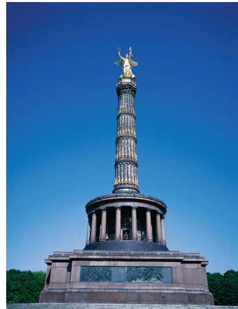
K08_033 CD-Rom: 08 Deutschland • Berlin • Siegessäule am Großen Stern