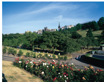
K08_036 CD-Rom: 08 Schottland • Edinburgh • Princess Street Gardens und Castle Hill