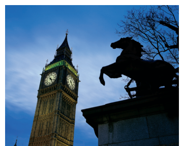
K08_030 CD-Rom: 08 England • London • Big Ben