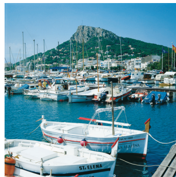
K08_023 CD-Rom: 08 Spanien • L'Estartit • Yachthafen