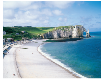
K08_003 CD-Rom: 08 Frankreich • Etretat • Bucht von Etretat