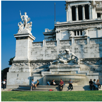
K08_017 CD-Rom: 08 Italien • Rom • Monumento Vittorio Emanuele