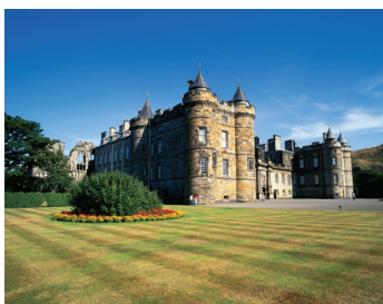
K08_009 CD-Rom: 08 Schottland • Edinburgh • The Palace of Holyroodhouse