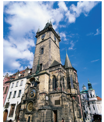
K08_042 CD-Rom: 08 Tschechien • Prag • Altstädter Rathaus mit Astron. Uhr