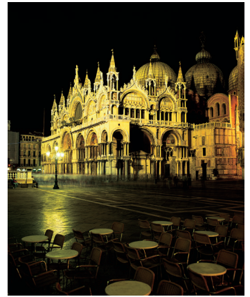
K08_034 CD-Rom: 08 Italien • Venedig • Markusplatz