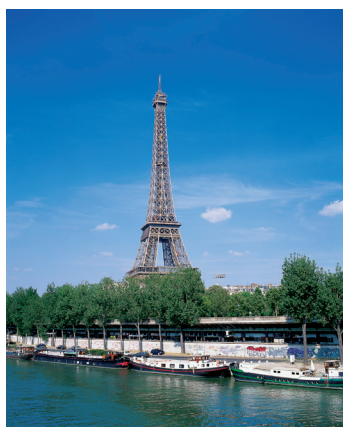
K08_014 CD-Rom: 08 Frankreich • Paris • Seine und Eiffelturm