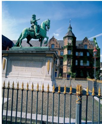
K08_050 CD-Rom: 08 Deutschland • Düsseldorf • Jan Wellem- Standbild vor dem Rathaus