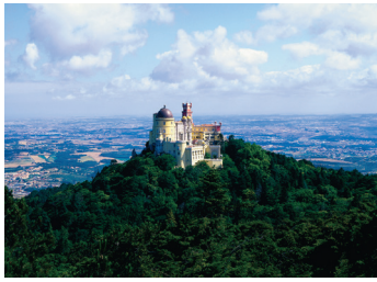
K08_031 CD-Rom: 08 Portugal • Costa do Estoril • Palacio da Pena bei Sintra