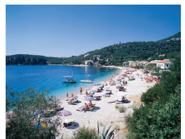
K08_016 CD-Rom: 08 Griechenland • Korfu • Bucht von Kalami