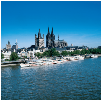
K08_049 CD-Rom: 08 Deutschland • Köln • Rhein, Dom und Groß- St. Martin