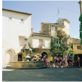
K08_019 CD-Rom: 08 Frankreich • Venasque • Radfahrergruppe