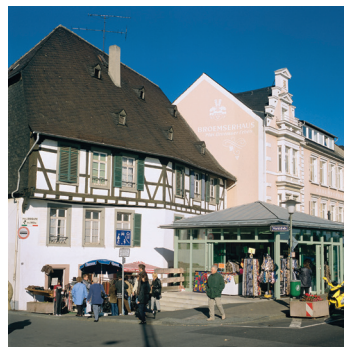
K08_022 CD-Rom: 08 Deutschland • Rudesheim • Broemserhaus