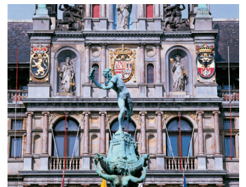
K08_028 CD-Rom: 08 Belgien • Antwerpen • Rathaus mit Brabon-Brunnen