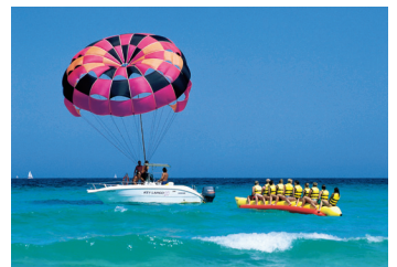
K08_024 CD-Rom: 08 Sport • Banana-Reiten