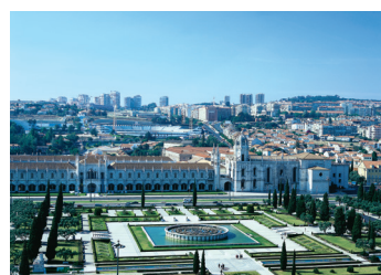
K08_029 CD-Rom: 08 Portugal • Lissabon • Mosterio dos Jeronimos in Belem