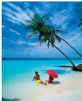
K08_044 CD-Rom: 08 Karibik • Pärchen am trop. Strand mit Palmen