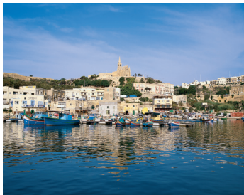
K08_005 CD-Rom: 08 Malta • Insel Gozo • Hafen von Mgarr