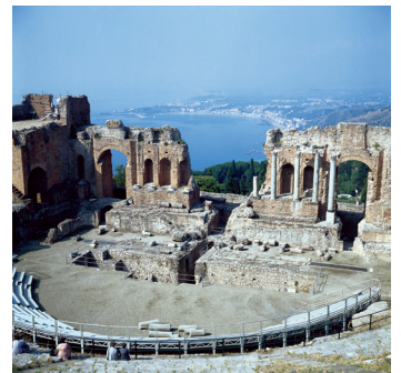
K08_038 CD-Rom: 08 Italien • Taormina/Sizilien • Griechisch-römisches Theater