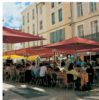
K02_057 CD-Rom: 04 Frankreich • Nîmes • Altstadt