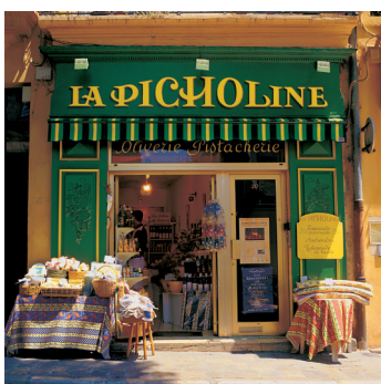
K02_063 CD-Rom: 04 Frankreich • Aix-en-Provence • Rrg. Köstlichkeiten