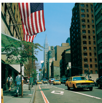
K02_091 CD-Rom: 04 New York • Manhattan • Lexington Avenue