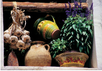
K02_098 CD-Rom: 04 Frankreich • Les Baux de Prov. • Stilleben