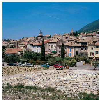
K02_089 CD-Rom: 04 Frankreich • Nyons/Provence • Stadtsicht