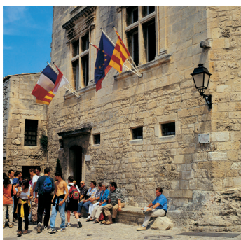
K02_079 CD-Rom: 04 Frankreich • Les Baux de Prov. • Hotel de Manville