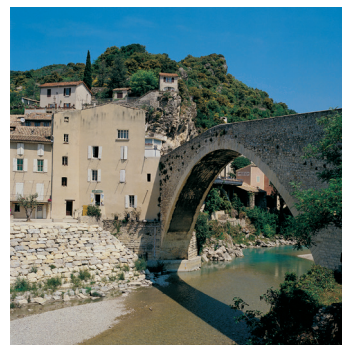
K02_090 CD-Rom: 04 Frankreich • Nyons/Provence • Pont Roman über Wildfluß Eygues