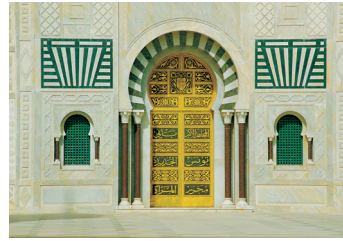
K02_053 CD-Rom: 04 Tunesien • Monastier • Mausoleum der Familie Bourgiba