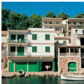
K02_096 CD-Rom: 04 Spanien • Mallorca • Cala Figuera