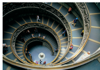
K02_093 CD-Rom: 04 Italien • Rom • Vatikanische Museen, Treppenaufgang