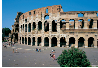
K02_099 CD-Rom: 04 Italien • Rom • Colosseo, das flav. Amphitheater