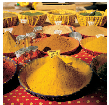
K02_074 CD-Rom: 04 Frankreich • Bédoin/Provence • Gewürze