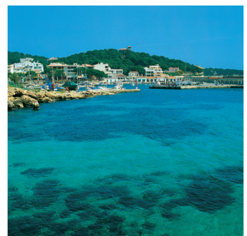
K02_082 CD-Rom: 04 Spanien • Mallorca • Cala Ratjada