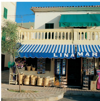
K02_083 CD-Rom: 04 Spanien • Mallorca • Port d'Antrax