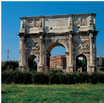
K02_075 CD-Rom: 04 Italien • Rom • Triumphbogen des Konstantin