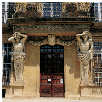
K02_097 CD-Rom: 04 Frankreich • Aix-en-Prov. • Pavillon Vendôme