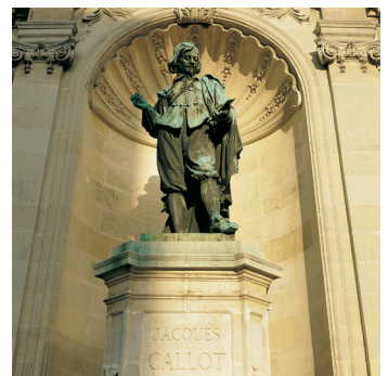
K02_058 CD-Rom: 04 Frankreich • Nancy • Denkmal Jaques Callot