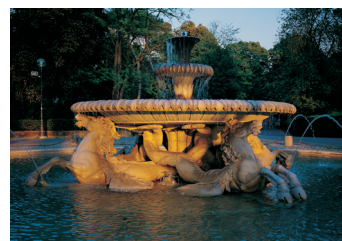
K02_094 CD-Rom: 04 Italien • Rom • Villa Borghese