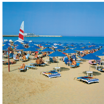
K02_085 CD-Rom: 04 Griechenland • Kreta • Strand von Rethymnon