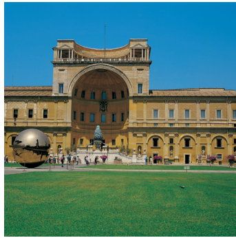
K02_052 CD-Rom: 04 Italien • Rom • Vatikanische Museen