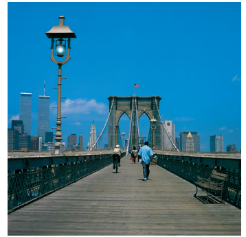
K02_070 CD-Rom: 04 New York • Manhattan • Brooklyn Bridge