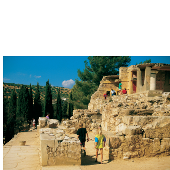
K02_080 CD-Rom: 04 Griechenland • Kreta • Knossos