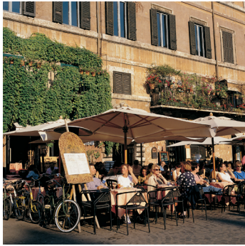
K02_051 CD-Rom: 04 Italien • Rom • Piazza Navona