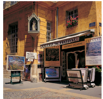
K02_062 CD-Rom: 04 Frankreich • Aix-en-Provence • Galerie/ Editions Cézanne