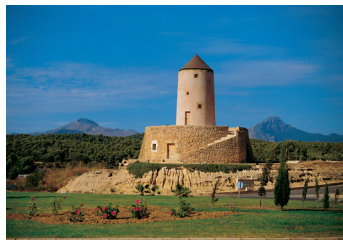
K02_072 CD-Rom: 04 Spanien • Mallorca • Santa Ponça