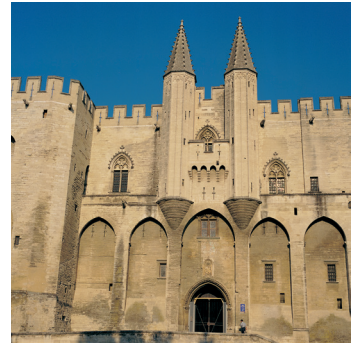
K02_054 CD-Rom: 04 Frankreich • Avignon • Papstpalast