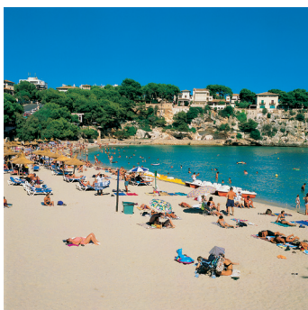
K02_095 CD-Rom: 04 Spanien • Mallorca • Strand von Porto Cristo