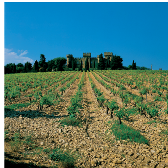
K02_077 CD-Rom: 04 Frankreich • Châteauneuf-du-Pape • Château „Des Fines Roches“