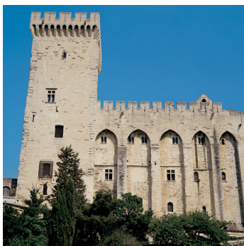
K02_055 CD-Rom: 04 Frankreich • Avignon • Papstpalast