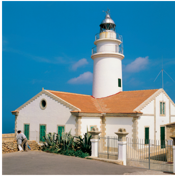
K02_067 CD-Rom: 04 Spanien • Mallorca • Cala Ratjada, Leuchtturm