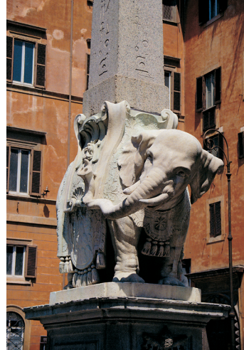
K02_100 CD-Rom: 04 Italien • Rom • Piazza de Minerva