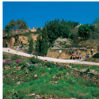
K02_073 CD-Rom: 04 Spanien • Mallorca • Capdepera, Kastell