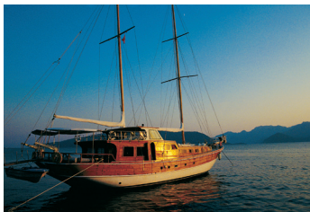
K02_059 CD-Rom: 04 Türkei • Marmaris • Bucht von Içmeler