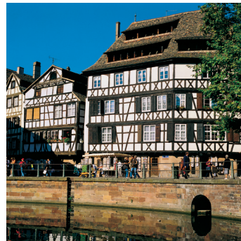
K02_061 CD-Rom: 04 Frankreich • Straßburg • Alte Gerberhäuser ander Ill