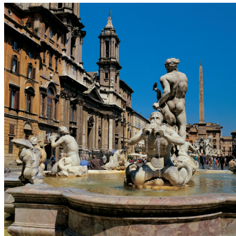
K02_076 CD-Rom: 04 Italien • Rom • Piazza Navona, Fontana del Moro