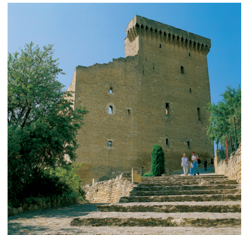
K02_078 CD-Rom: 04 Frankreich • Châteauneuf-du-Pape • Sommerresidenz der Päpste