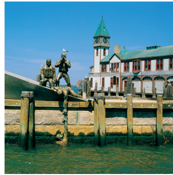
K02_069 CD-Rom: 04 New York • Manhattan • Battery Park