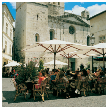
K02_056 CD-Rom: 04 Frankreich • Nîmes • Place des Herbes mit Kathedrale St. Castor