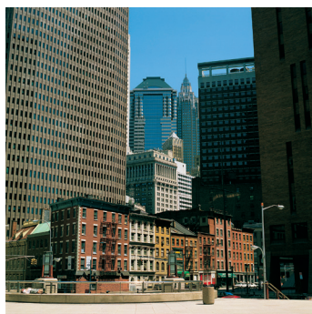
K02_092 CD-Rom: 04 New York • Manhattan • Financial District