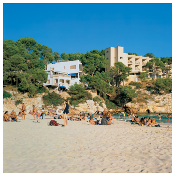
K02_084 CD-Rom: 04 Spanien • Mallorca • Cala Santanyi