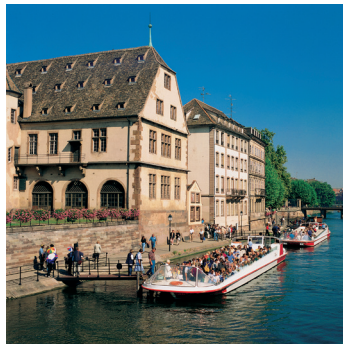
K02_060 CD-Rom: 04 Frankreich • Straßburg • Stadtführung mit dem Boot auf der Ill