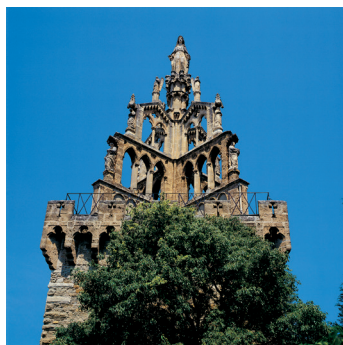
K02_088 CD-Rom: 04 Frankreich • Nyons/Provence • Tour Randonne