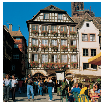
K02_086 CD-Rom: 04 Frankreich • Straßburg • Altstadt