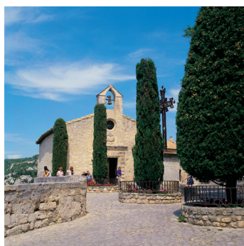
K02_064 CD-Rom: 04 Frankreich • Les Baux de Prov. • Place St. Vincent