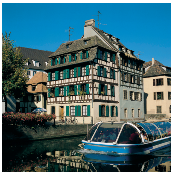
K02_087 CD-Rom: 04 Frankreich • Straßburg • Alte Gerberhäuser an der Ill