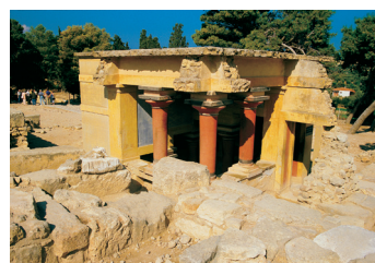
K02_065 CD-Rom: 04 Griechenland • Kreta • Knossos, Minoischer Palast