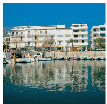
K02_066 CD-Rom: 04 Spanien • Mallorca • Hafen von Cala Bona