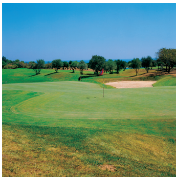
K02_071 CD-Rom: 04 Spanien • Mallorca • Golfplatz Cala d'Or